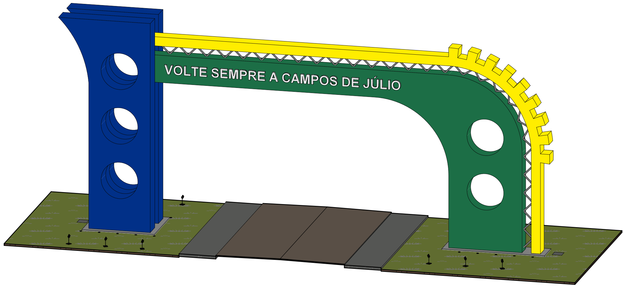
3 3D - Posterior